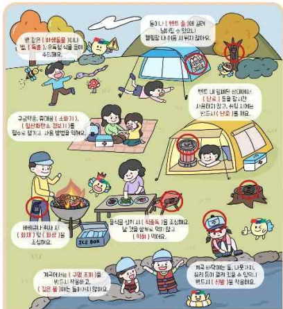
<재미있는 안전 용품 숨은 그림 찾기>