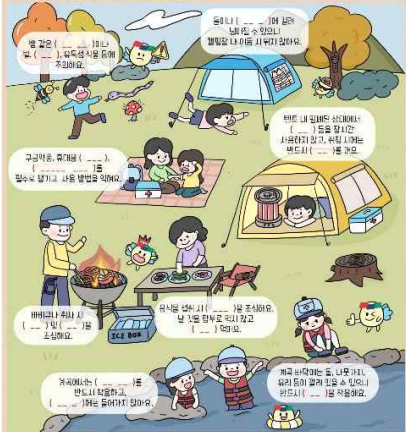
<재미있는 안전 용품 숨은 그림 찾기>